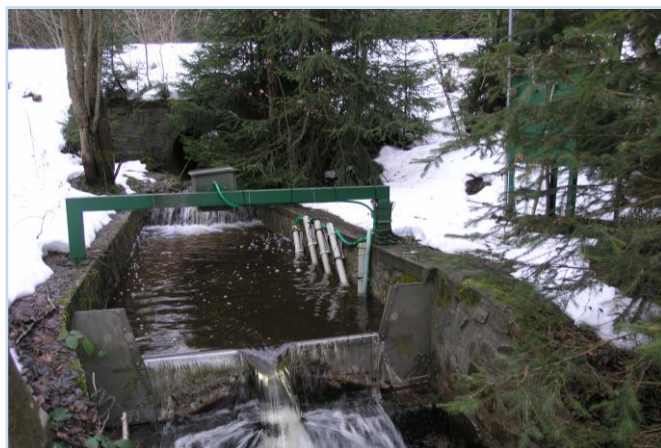
Uzávěrový profil povodí Liz (0,99 km 2 , 828 – 1074 m n.m.).