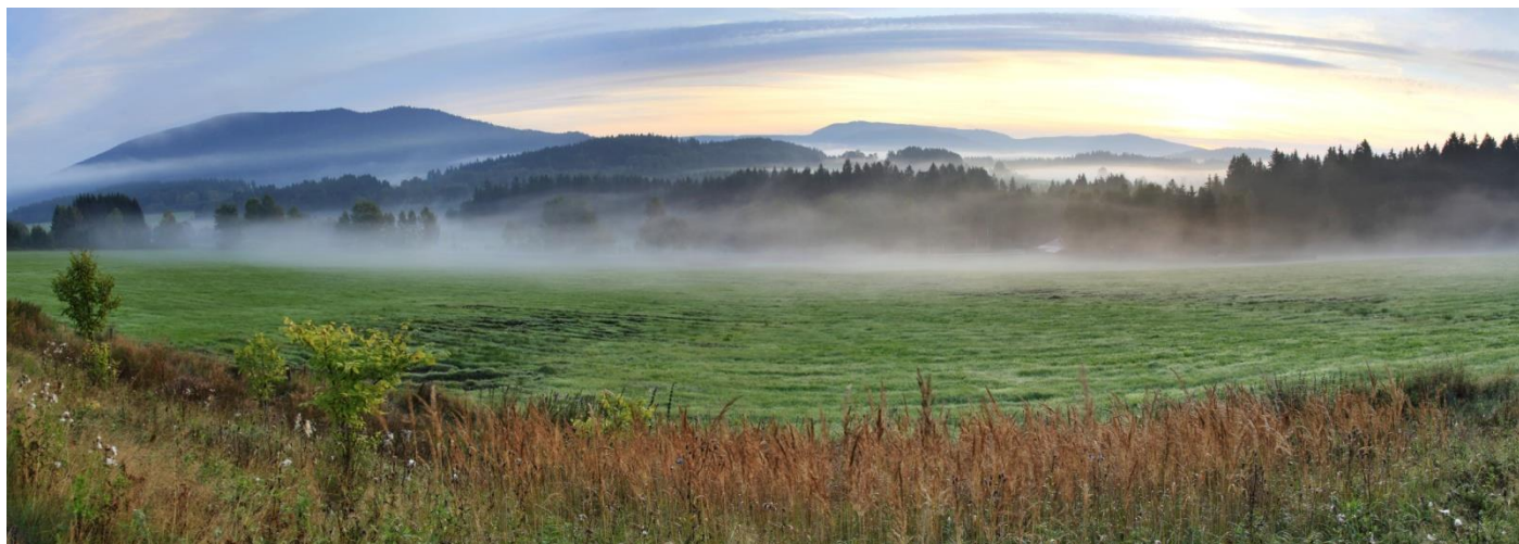
Krajina v okolí hotelu České Žleby.

Ubytování účastníků workshopu bude ve dvoulůžkových pokojích v několika provedeních (základ, apartmán a mezonet). Ubytování si hradí každý účastník sám v průběhu akce na recepci. Na akci byla získána sleva, čímž bylo dosaženo ceny od 620,- Kč/os.noc pro základní dvoulůžkový pokoj do 800,- Kč./os.noc. pro pokoje v apartmánech. Počet ubytovací kapacity je limitován možnostmi hotelu, a proto organizátoři uvítají vstřícný přístup potenciálních zájemců při vyplňování přihlášky v bodě sdílení pokoje. V případě individuálních účastníků, kdy např. bude jediný účastník z pracoviště bez znalosti ostatních přihlášených, budeme tuto situaci řešit individuálně s vírou v plné uspokojení všech účastníků.